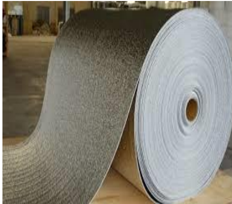
xốp PE 1 mặt bạc