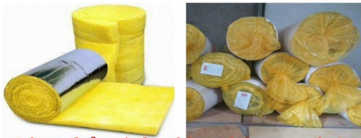
Bông thủy tinh có bạc ( dạng cuộn)