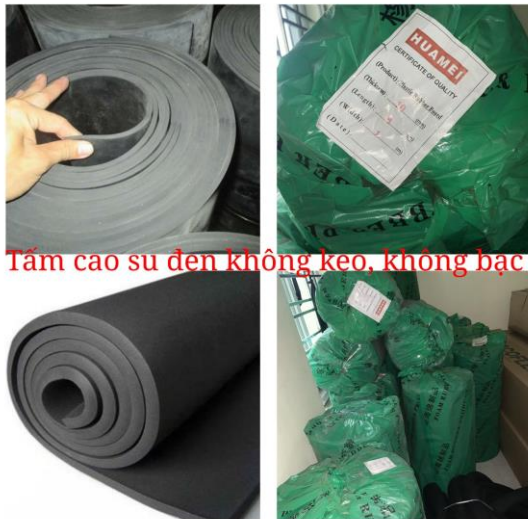
Tấm cao su đen không keo, không bạc