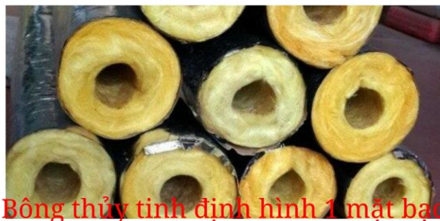
Bông thủy tinh định hình 1 mặt bạc

ĐIÊN LẠNH HC : 0222.3844.668 (0986.502.239) Hotline: 0988.558.022